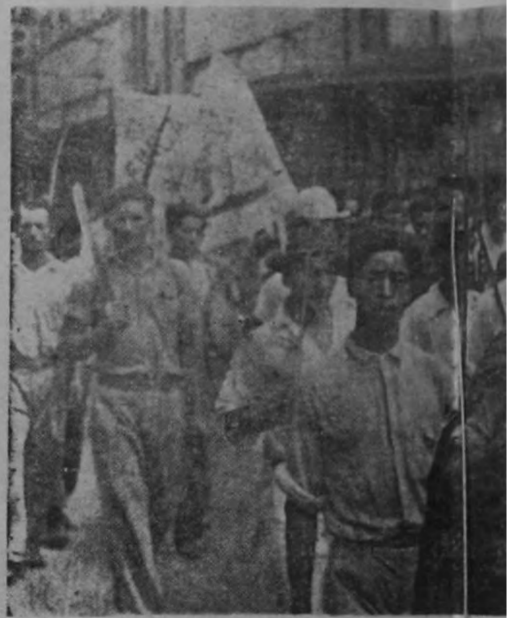
LA CIUDAD EN MANOS de