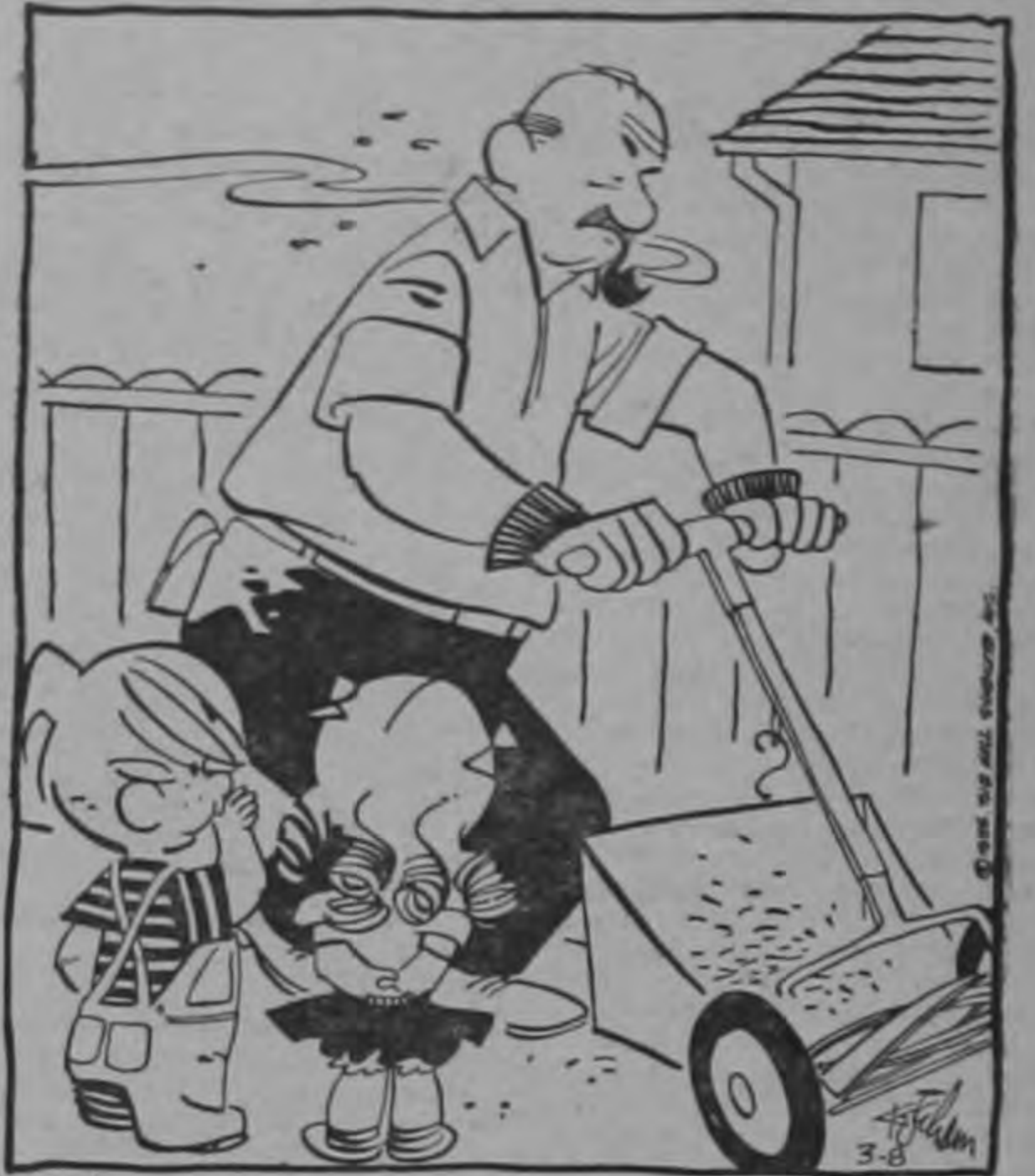
El señor Bertólez parece un poco cascarrabias... Cuando llevas un tiempo tratándolo, te das cuenta de que lo es