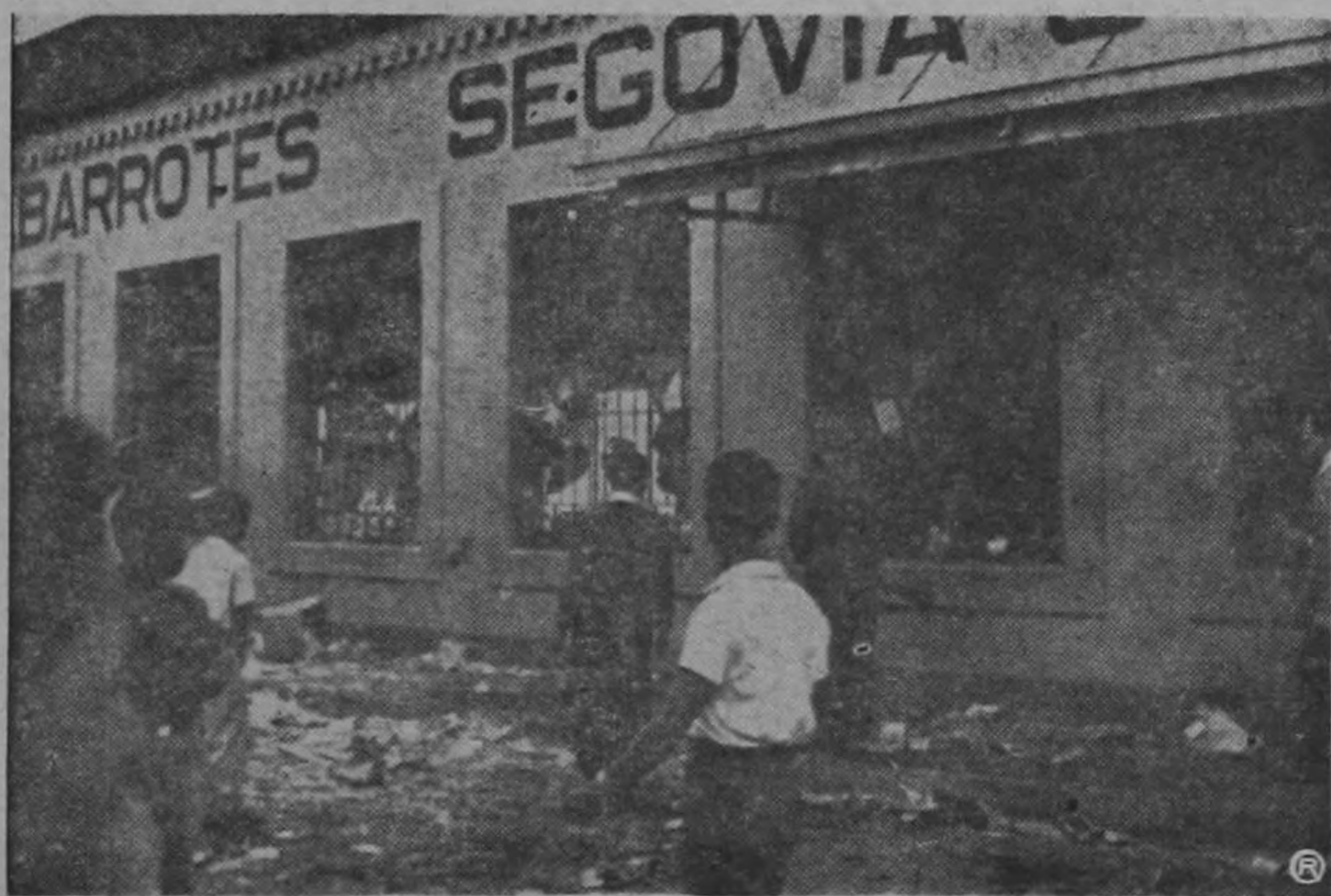
EL COMERCIO SAQUEADO