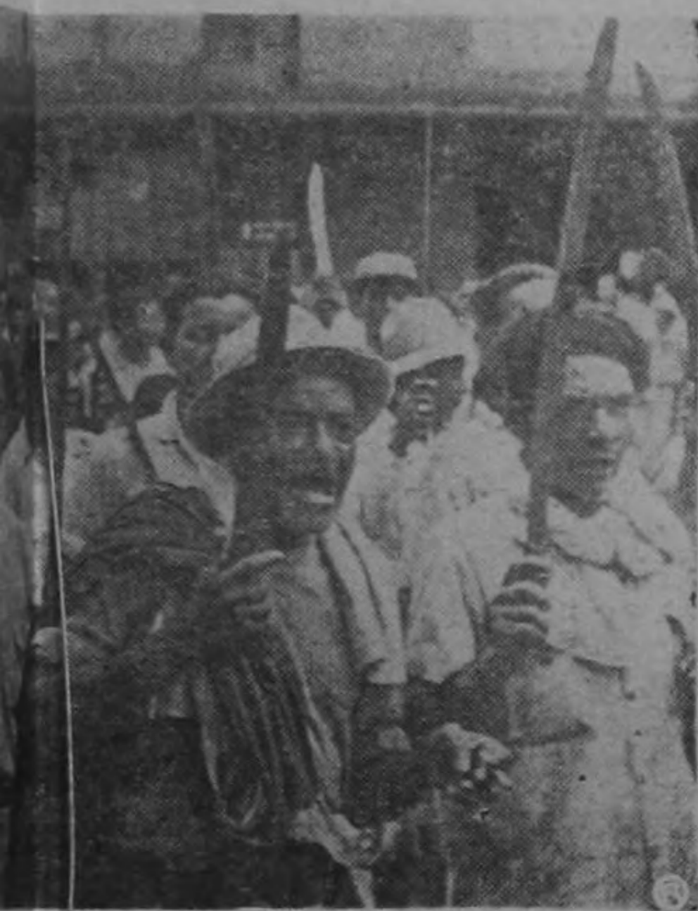
INOS de los "MARIACHIS"